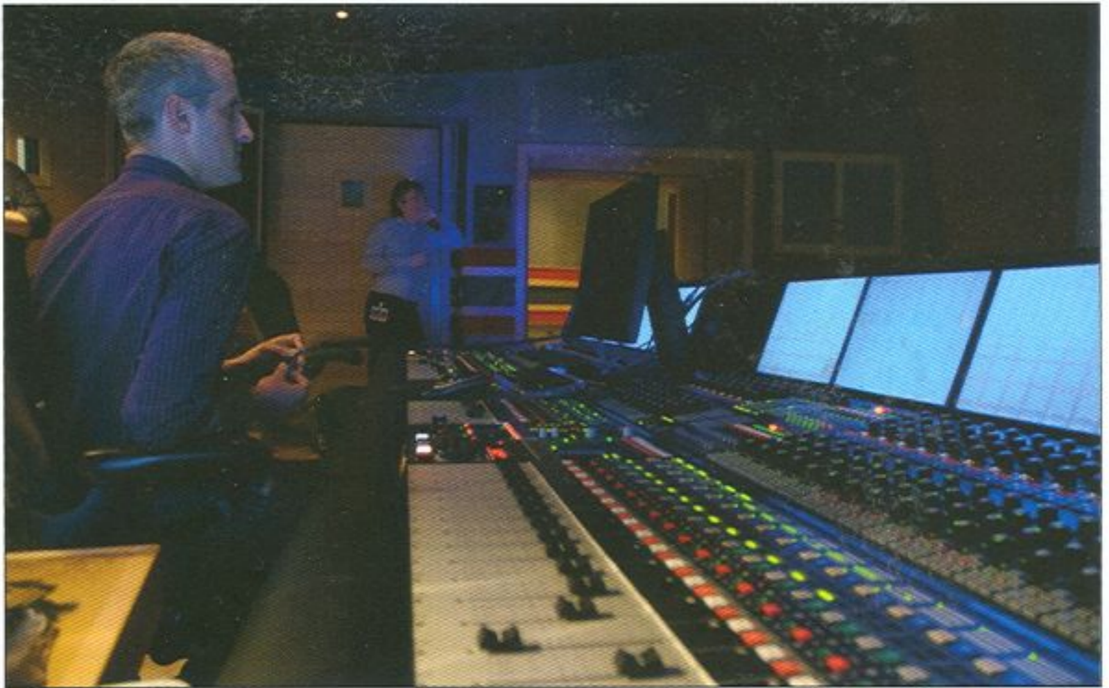
Neve DFC Konsole

ellen Expansionsprojekten keineswegs aus den Augen verloren. Von einem reinen Audio-Komplex der Superlative ausgehend hat sich Galaxy zwischenzeitlich zu einem Komplettdienstleister entwickelt, der auch die Bildproduktion auf höchstem Niveau in sein Portfolio aufgenommen hat. In der oberen Etage des Gebäudes entstand ein HiTech-Bildbearbeitungszentrum, das die Qualitätsansprüche an die Audiotechnik und die damit einhergehende Bau- und Raumakustik konsequent aufgreift. Das neue Neve DFC Filmmischpult wurde nahtlos in die technischen Strukturen der Studios integriert und verfügt über eine Kanalkapazität von 500 Kanälen bei einer Abtastrate von 96 kHz, oder entsprechend 1.000 Kanälen bei halbiertes Abtastrate. Das technologische Angebot der Galaxy Studios reicht damit von der analogen Großkonsole API Vision, über die Film- und digitale Musikmischung bis hin zum HiTech-Mastering und der professionellen Bildproduktion, deren Kapazitäten vor allem auf HD und Kino ausgerichtet sind. Die 72kanalige VR-Konsole aus der dritten Regie zieht in die Galaxy-Niederlassung Antwerpen um, während die Regie zurzeit für neue spannende Audioproduktionsaufgaben